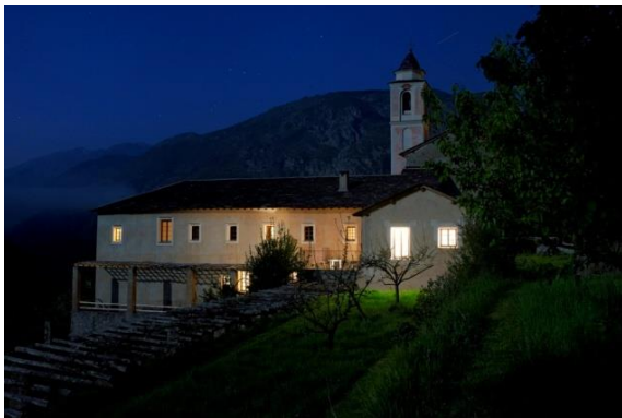
Monastère de Saorge – Nocturne

Né à la Ciotat en 1974, Michel Eisenlohr est auteur photographe depuis une quinzaine d'années. Son itinéraire photographique est le fruit d'une passion pour la littérature de voyage et de ce goût de l'Autre qu'il renouvelle à chaque sujet, chaque destination. Il cherche à capter de son regard l'esprit des lieux, qu'il s'agisse de paysages contemporains ou d'architectures chargées de mémoire.