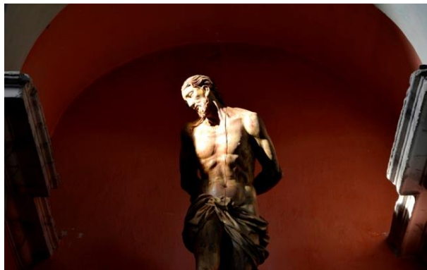
Monastère de Saorge – Ecce Homo

Outre les nombreuses expositions qu'il a réalisées, Michel Eisenlohr a également publié plusieurs ouvrages sur le patrimoine architectural de Marseille dont le dernier « Palais Longchamp, monumental et secret » a été préfacé par l'architecte Rudy Ricciotti :