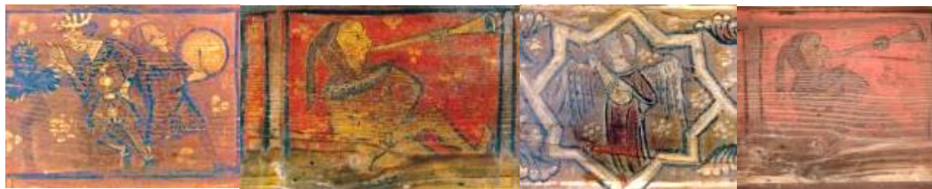
Le plafond peint – Musiciens - Cloître de la cathédrale de Fréjus

Exposition - concert d'instruments anciens, animée par quatre musiciens. Au travers de l'interprétation festive de musiques médiévales, l'instrumentarium permet de faire revivre de nombreux instruments anciens, tout en expliquant leur origine, leur fonctionnement et leur filiation avec nos instruments contemporains. Les enfants et leurs parents pourront échanger avec les musiciens, leur poser des questions et participer aux démonstrations, en vrais petits troubadours ! Une plongée dans l'univers de la musique médiévale, des troubadours et des trouvères, à travers une exposition-concert vivante et pédagogique.