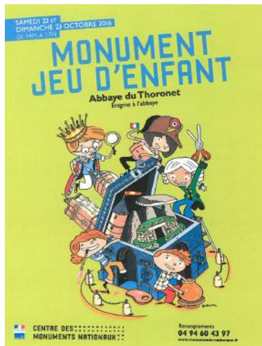
Affiche et flyer