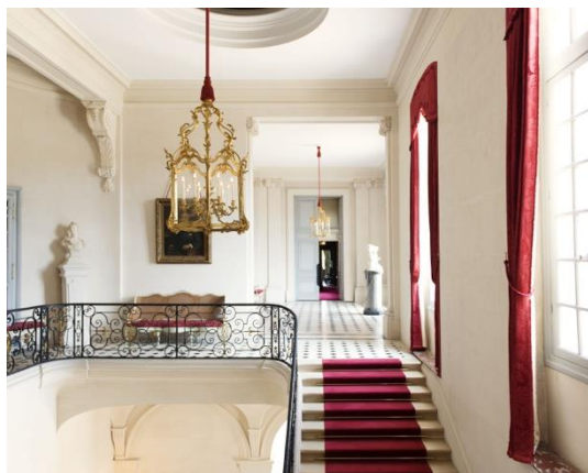
5. Vestibule du 1 er étage