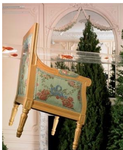
3. « Le Bal Décisif » © Jean-Luc Bichaud