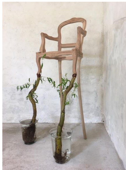
2. « Carcasses » © Jean-Luc Bichaud