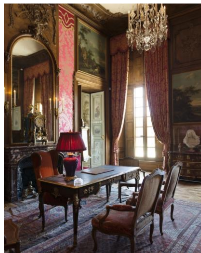
4. Salon Rouge