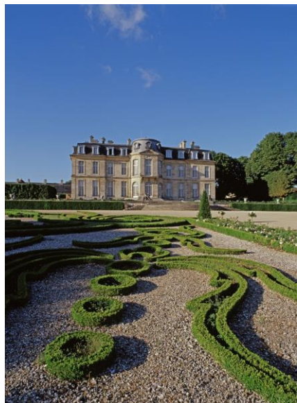
1. Le château de Champs et ses broderies