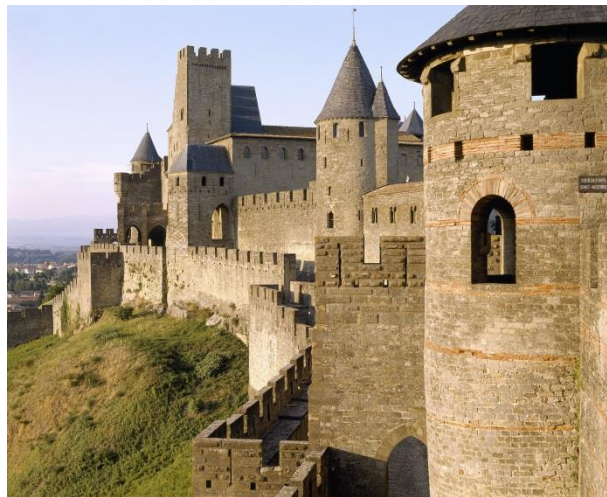
Alain Lonchamp - Centre des monuments nationaux

Le monument est ouvert au public par le Centre des monuments nationaux. En 2016, 550 717 personnes y ont été accueillies.