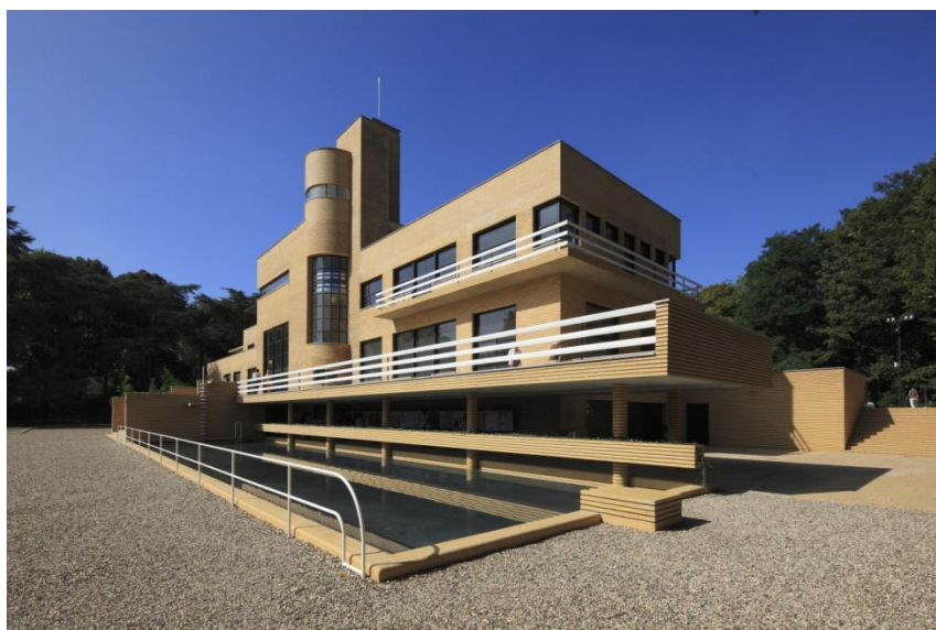
© Jean-Luc Paillé – CMN - © Robert Mallet-Stevens

Conçue par Robert Mallet-Stevens, terminée en 1932, la villa Cavrois est considérée comme un chef d'œuvre de l'architecture moderniste. Occupée par la famille jusqu'en 1987, elle subit de nombreux dommages entre 1988 et 2001, bien qu'elle ait été classée monument historique le 10 décembre 1990. Acquis par l'Etat en 2001, elle est remise en dotation à son opérateur de référence, le Centre des monuments nationaux, en 2008, afin qu'il assure la restauration du parc et des intérieurs, la mise en valeur et la présentation au public de ce monument majeur du XX e siècle. Le CMN a ainsi achevé la vaste campagne de restauration du clos et du couvert engagée par la Direction régionale des affaires culturelles du Nord-Pas-de-Calais en 2003.