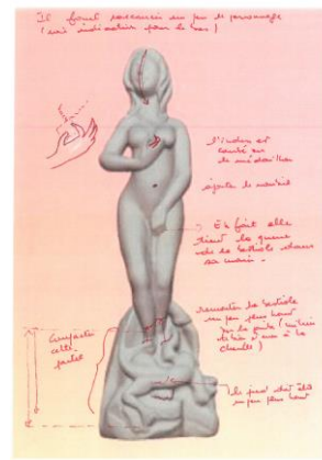
Projet de restitution 3D de La femme à la salamandre. E.Matruchot, 1914 P.Pichoutou/Matrix3D Concept 2018