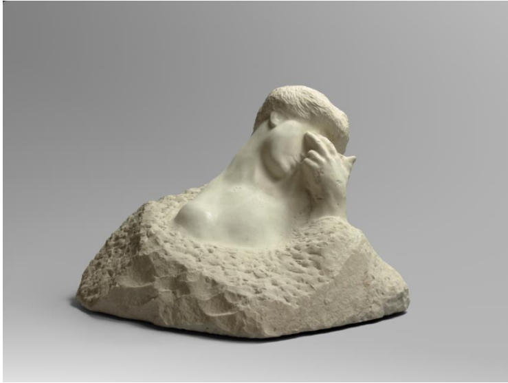
Mme Fenaille à la main, marbre