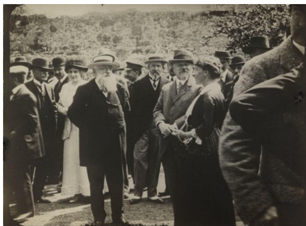
Cérémonie de donation du château de Montal, le 17 septembre 1913

En mai 1913 Maurice Fenaille fait don à l'État, sous réserve d'usufruit pour lui et ses enfants, du château et de son mobilier, accompagné d'un domaine d'une vingtaine d'hectares et de 200 000 francs dont les revenus et bénéfices doivent servir à l'entretien du monument. Ce don est célébré par une réception au château en présence du président Raymond Poincaré en septembre de la même année.