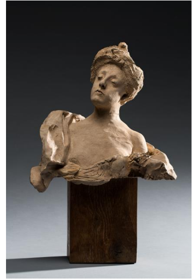
Mme Fenaille, terre cuite