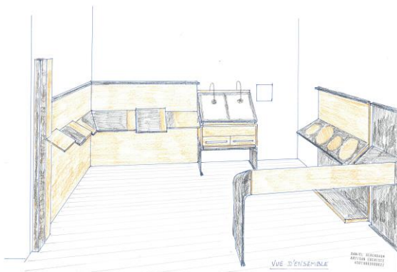
Aménagement exposition permanente. Projet de mobilier Conception et réalisation D.Berenbaum/Le cœur du bois

À l'occasion de la présentation temporaire « Rodin, Fenaille, Matruchot : portraits d'une Renaissance », un nouvel espace dédié à la médiation sera présenté au public dans la tour Sud-Ouest. À la fin du parcours libre du premier niveau, les visiteurs seront invités à découvrir l'histoire des protagonistes de la restauration du château au début du XX e siècle, ainsi qu'un développement sur l'art du portrait. Ces aménagements comprendront notamment des objets 3D interactifs et ludiques, accessibles à tout public et viendront compléter les installations vidéo et numériques déjà présentes dans le parcours et la visite guidée. Les approfondissements sur Maurice Fenaille, Auguste Rodin et Emile Matruchot, ainsi que sur les portraits de Jeanne de Balsac et Marie Fenaille, constitueront un bel écho au parcours installé dans les autres salles du château.