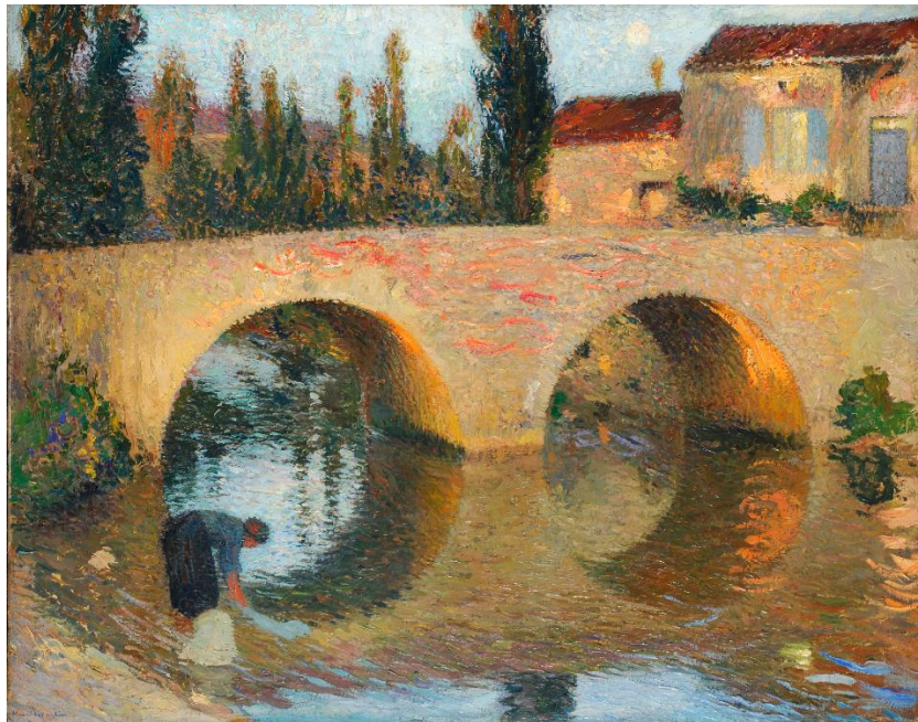
Henri Martin, XIXe s. Le Pont de la Bastide - Inv. B 906