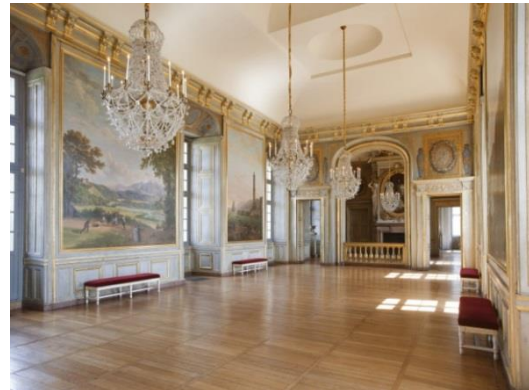
Salle de bal