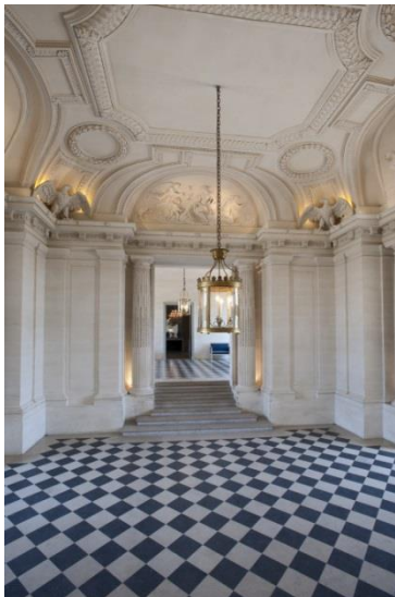
Vestibule d'honneur