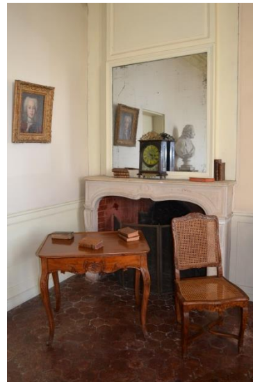
Chambre Voltaire