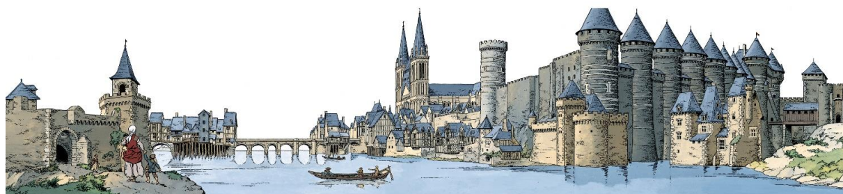
© CHAILLET / ÉDITIONS DU LOMBARD (Dargaud-Lombard sa) 2010

L'ultra-réalisme de Chaillet aurait tôt fait d'accoler à cette série une étiquette « BD historique » dont l'aspect pédagogique pourrait parfois sembler lénifiant. Ce serait rendre bien mauvaise justice à la profondeur d'une œuvre dont le réalisme ne s'arrête pas aux décors et à l'anatomie. À la relecture, Vasco s'impose comme une œuvre éminemment moderne dans son écriture, en droite ligne de la cynique froideur des Rois Maudits .