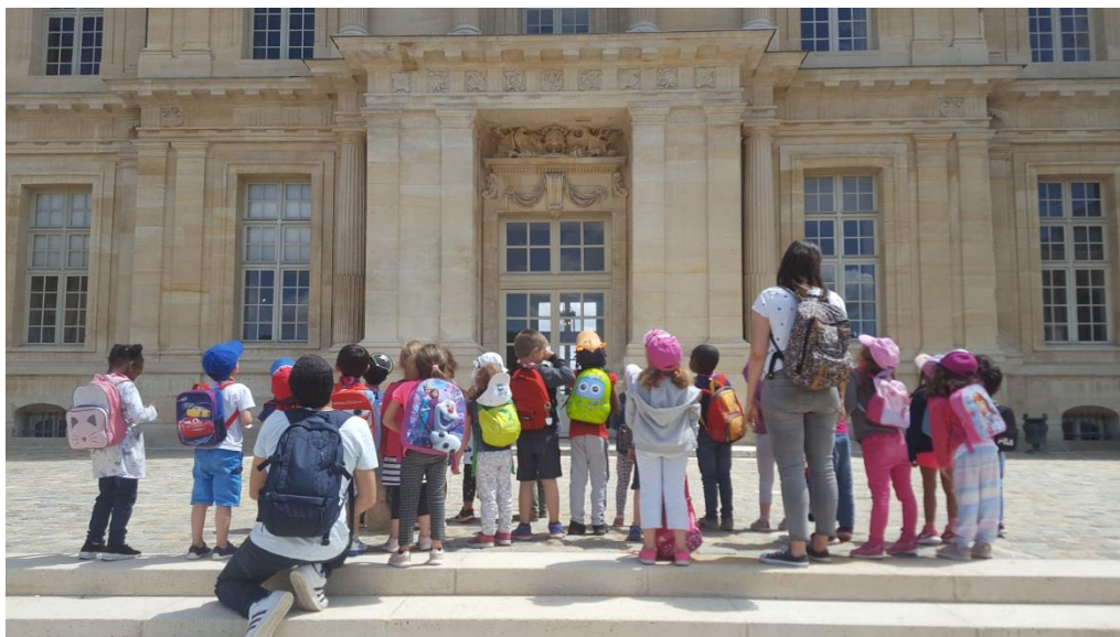
Le château de Maisons à Maisons-Laffitte

Le Centre des monuments nationaux propose tout au long de l'année 2020 des activités à destination du jeune public au château de Maisons, à Maisons-Laffitte. Ateliers de découverte de décors mythologiques ou encore initiation à l'histoire à travers les personnages de tableaux, autant d'animations qui permettront aux enfants de découvrir le patrimoine de manière ludique et éducative.