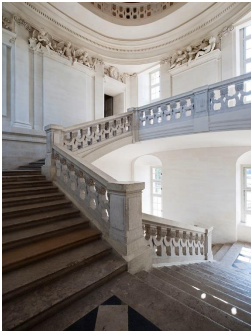
Escalier du château de Maisons