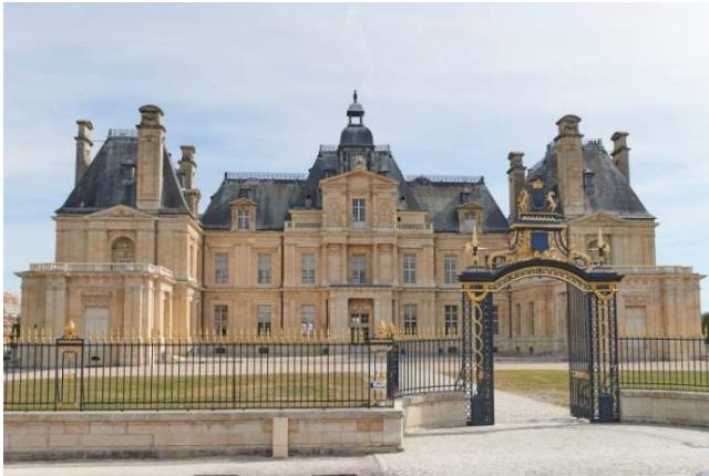
Le château de Maisons à Maisons-Laffitte