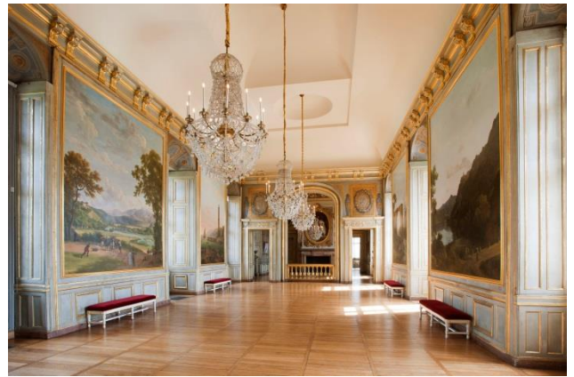
La grande salle haute du château de Maisons à Maisons-Laffitte