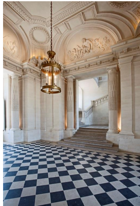
Vestibule central du château de Maisons à Maisons-Laffitte