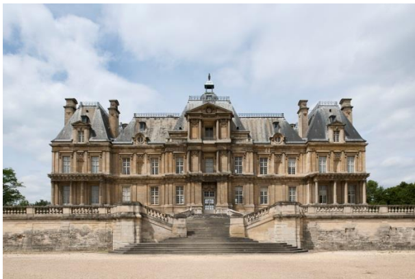
Façade sur jardin du château de Maisons

Depuis sa création, le château de Maisons n'a jamais cessé d'être considéré comme l'une des plus grandes réussites de l'art français. Il est l'archétype, l'exemple le plus raffiné du château classique français. Situé dans les boucles de la Seine, non loin de Saint-Germain-en-Laye, le château de Maisons, construit par François Mansart (1598-1666) dans la première moitié du XVII e siècle pour René de Longueil, président au mortier du parlement de Paris est également considéré comme l'un des grands chefs-d'œuvre de l'architecte,