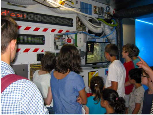
Le module Marion Montaigne © Le Miroir de Poitiers