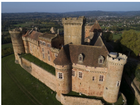
Château de Castelnaud-Bretenoux

A une vingtaine de kilomètres de Rocamadour et de Padirac, le château de Castelnaud-Bretenoux s'élève à l'extrémité d'un éperon rocheux né d'une faille naturelle. Dominant le pays dit « des quatre rivières », la Cère et la Bave, affluents de la Dordogne, ainsi que le Mamoul, il fut le siège d'une importante baronnie issue de l'aristocratie carolingienne quercynoise, les Castelnaud de Bretenoux, déjà possesseurs d'une résidence fortifiée dans les environs au XI e siècle. Le château actuel n'est pas antérieur au XIII e siècle. Au cours des XIV e et XV e siècles, le château adopte sa configuration quasi définitive, avec un ensemble de corps de logis cantonnés de tours,