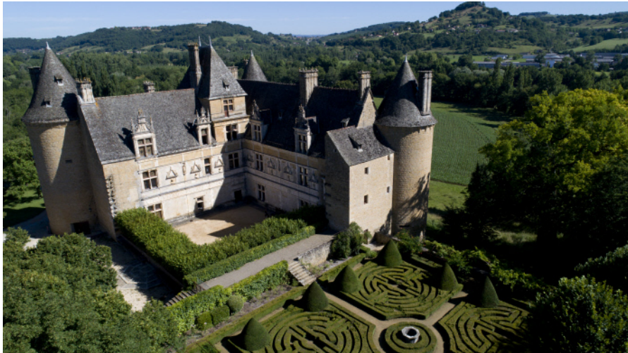
Château de Montal

Le Centre des monuments nationaux est heureux d'annoncer la réouverture du château de Montal le 15 juin 2020. Dans le strict respect des consignes sanitaires, les visiteurs seront accueillis en toute sécurité au château et pourront ainsi partir à la (re)découverte de leur patrimoine, et de ce joyau de la Renaissance française au décor sculpté unique.