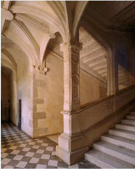
Château de Montal