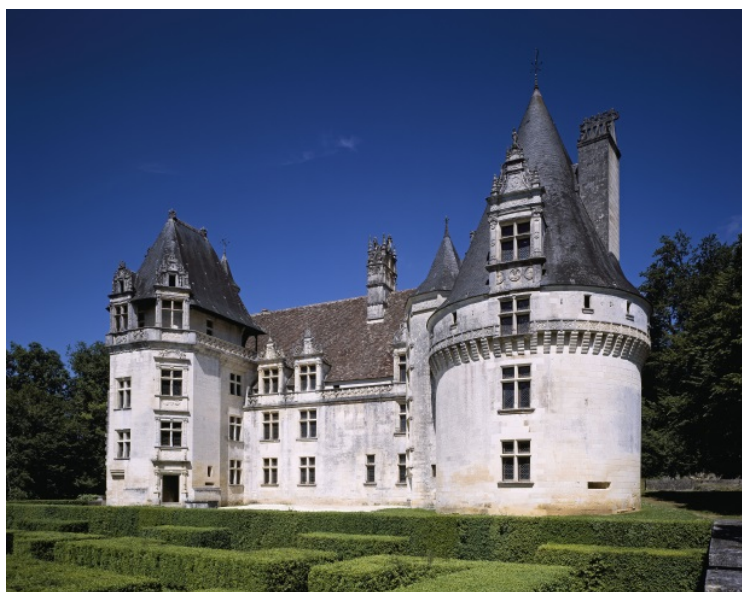
Château de Puyguilhem