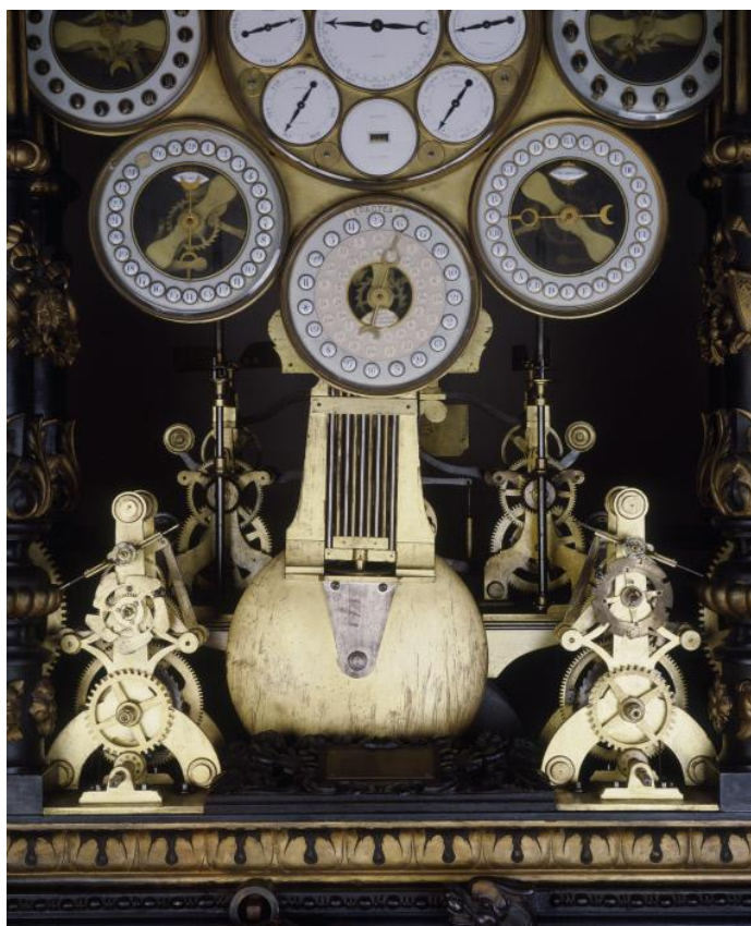
Horloge astronomique de Besançon