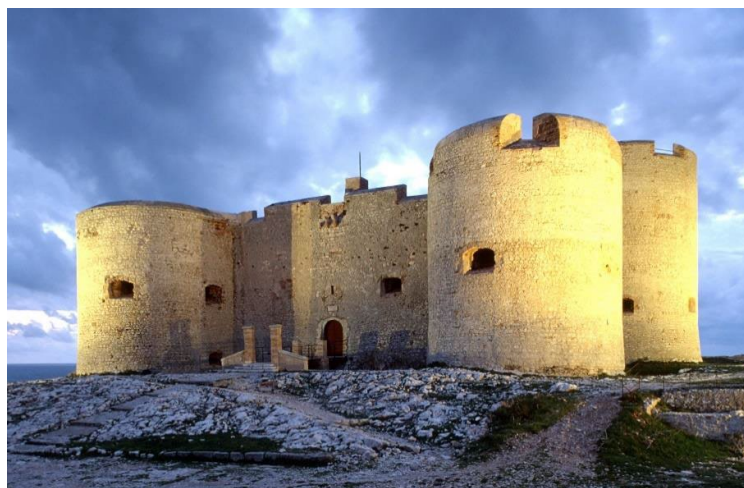
Château d'If

En 1516, François I er , roi de France, s'arrête à Marseille après la victoire de Marignan. De l'île d'If, il peut étudier les défenses de la ville pour constater que rien ne la protège contre les invasions. Il ordonne alors la construction d'une forteresse sur l'île. Ce n'est qu'en 1524, après une attaque de Charles Quint, que les premiers murs du château sont construits pour pouvoir enfin protéger l'accès du port de Marseille.