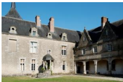
Vue de la première cour du château de Talcy