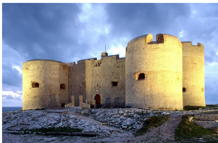
Château d'If

En 1516, François I er , roi de France, s'arrête à Marseille après la victoire de Marignan. De l'île d'If, il peut étudier les défenses de la ville pour constater que rien ne la protège contre les invasions. Il ordonne alors la construction d'une forteresse sur l'île. Ce n'est qu'en 1524, après une attaque de Charles Quint, que les premiers murs du château sont construits pour pouvoir enfin protéger l'accès du port de Marseille.