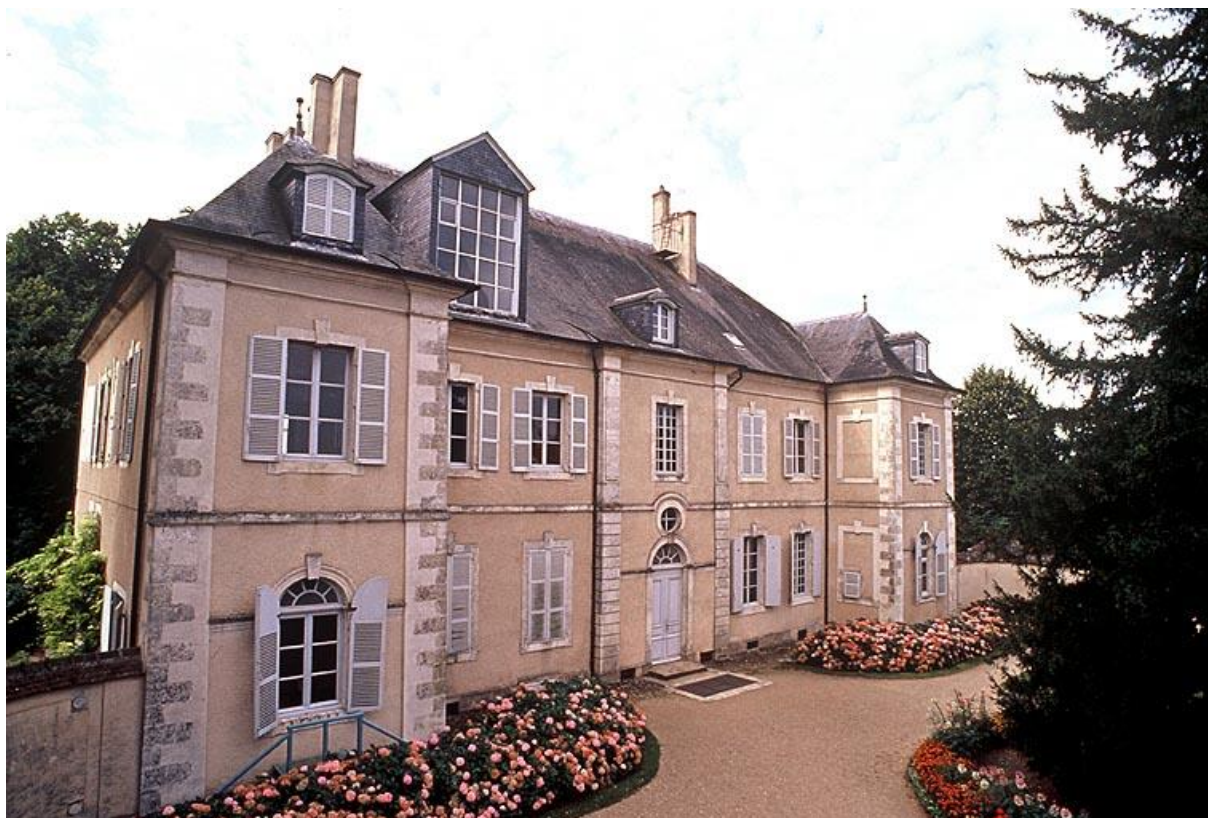
Maison de George Sand

La maison de Nohant est ouverte au public par le Centre des monuments nationaux.