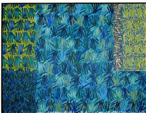
Gérard Titus-Carmel – Brisée - Sur la Route de la Soie XIV – 2009 – Acrylique sur toile – 195x260 cm

Dans le cadre de sa programmation culturelle 2017, le Centre des monuments nationaux invite Gérard Titus-Carmel à investir la tour Saint-Nicolas et la tour de la Lanterne avec des œuvres monumentales récentes, peintures et dessins dont une série totalement inédite, Labyrinthes .