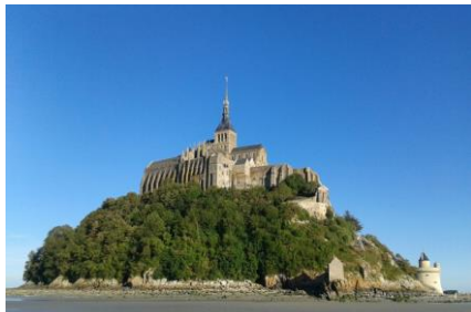
Abbaye du Mont-Saint-Michel

Dominant le village fortifié et ses charmantes ruelles, l'abbaye témoigne de la maîtrise et du savoir-faire du Moyen Age. Elle rassemble plus de 20 salles dont notamment une chapelle préromane, des bâtiments religieux, un ensemble gothique surnommé « la Merveille » et un chœur gothique flamboyant.