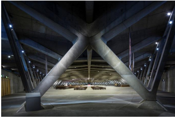
Basilique Saint Pie X, Lourdes