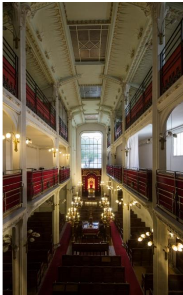
Synagogue, rue Pavée, Paris IV e