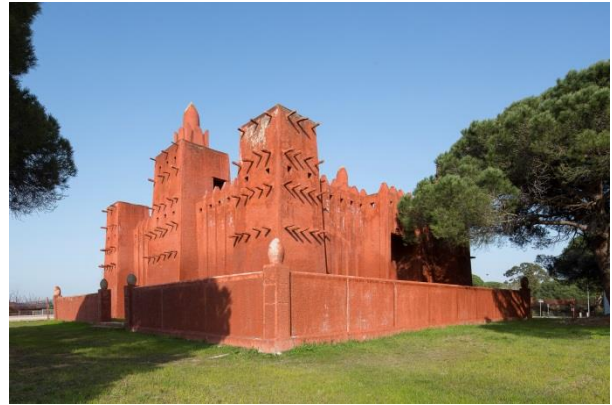
Mosquée Missiri, Fréjus