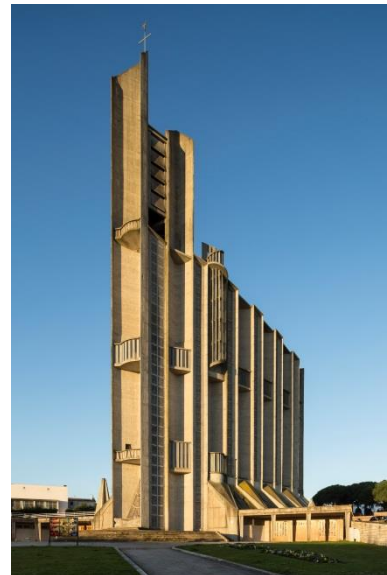
Eglise Notre-Dame, Royan