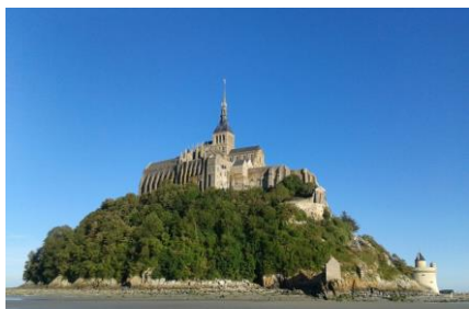
Abbaye du Mont-Saint-Michel

Dominant le village fortifié et ses charmantes ruelles, l'abbaye témoigne de la maîtrise et du savoir-faire du Moyen Age. Elle rassemble plus de 20 salles dont notamment une chapelle préromane, des bâtiments religieux, un ensemble gothique surnommé « la Merveille » et un chœur gothique flamboyant.