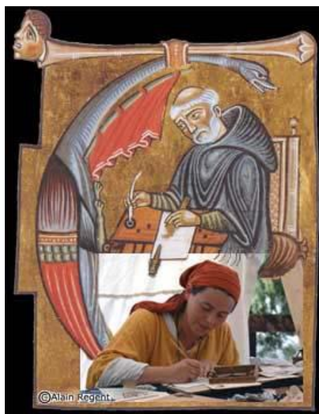
Empreinte d'histoire – Atelier de calligraphie

Un parcours ludique et familial ponctué d'énigmes à résoudre et d'ateliers d'initiation à la calligraphie, à l'enluminure et à la reliure pour comprendre les étapes de fabrication d'un manuscrit au Moyen Age. Les enfants et leurs parents pourront échanger avec les intervenants et participer à des démonstrations, en vrais copistes !