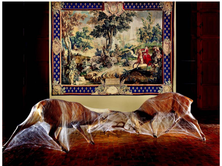
Arachné (combat de cerfs)