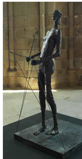
Le Diabolo, au Mont-St-Michel, 2017.