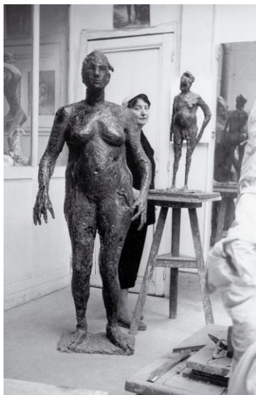
Germaine Richier dans son atelier de l'avenue de Châtillon, à Paris, dans les années 1950.

L'exposition « Germaine Richier, l'Ouragane » propose un dialogue placé sous le signe des éléments entre les œuvres et le site, la sculpture et l'architecture. Celui ou celle qui traverse l'immense baie fait l'expérience de l'air et du vent, de la lumière claire et changeante qui efface les distances jusqu'à l'horizon. Aux périodes de grandes marées, le Mont est cerné par les eaux jusqu'à devenir, certains jours, une île. Dans ce paysage horizontal se dresse un rocher de granit d'où émerge l'un des plus extraordinaires édifices de l'architecture religieuse, une triomphale architecture de pierre surplombée d'une flèche. »