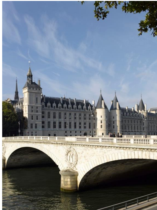
La Conciergerie

La Conciergerie est ouverte par le Centre des monuments nationaux et a accueilli 381 707 visiteurs en 2017.