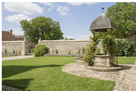
3-Cour d'honneur du château de Talcy