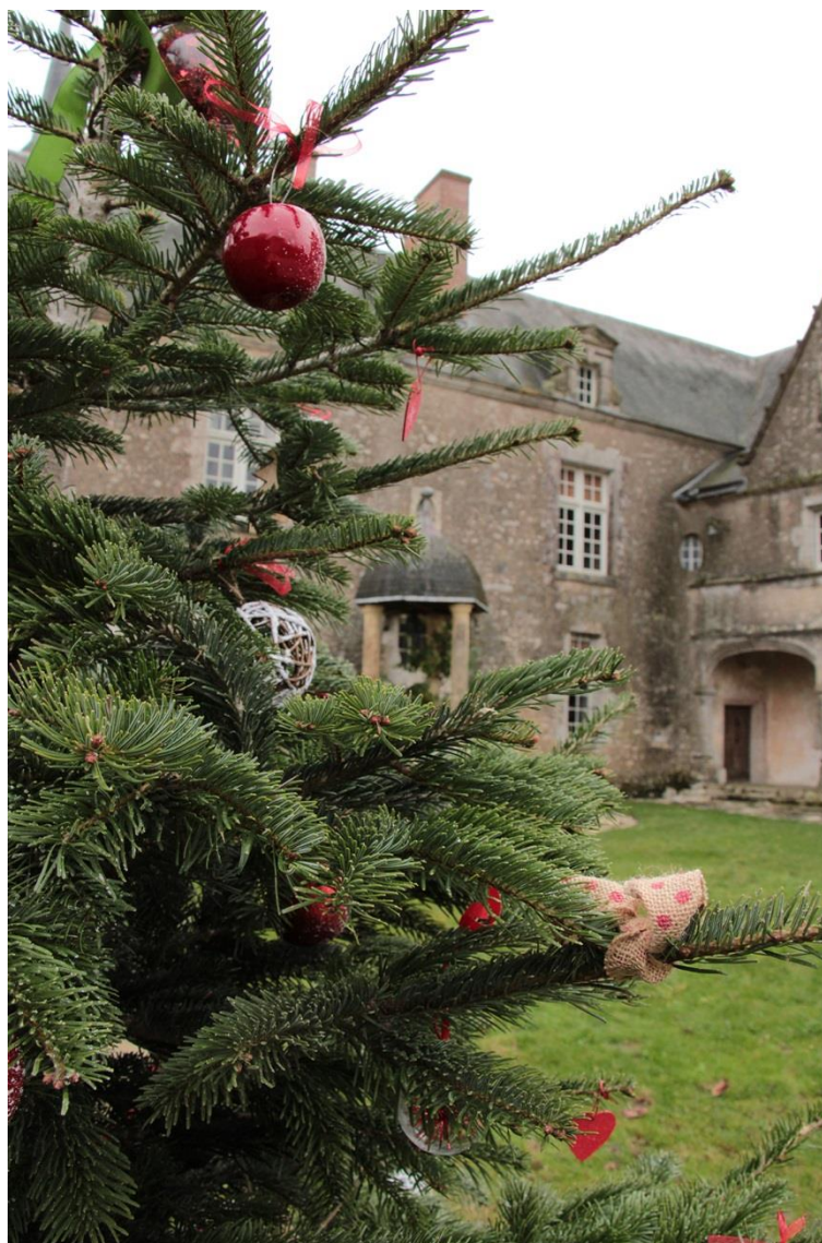
Château de Talcy, cour d'honneur