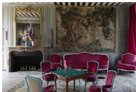
4-Salon de compagnie du château de Talcy