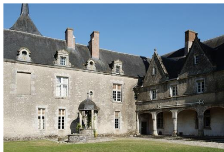
2-Façade sur cour et galerie du château de Talcy