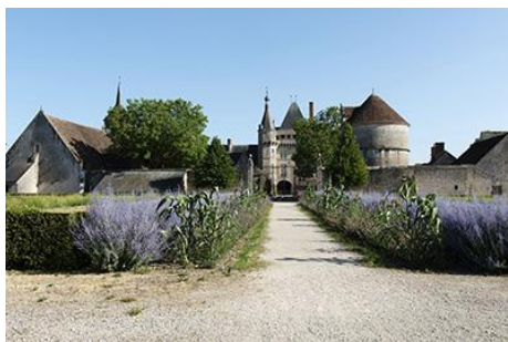
1-Jardin du château de Talcy