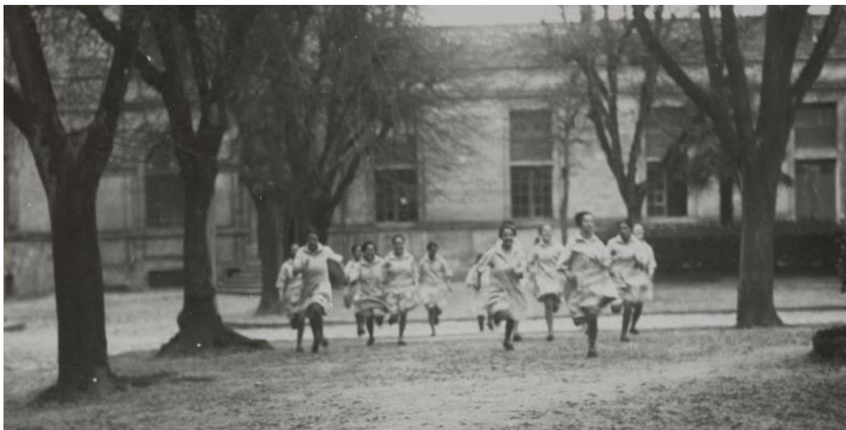
Pupilles faisant la course dans la cour de l'école de préservation de Cadillac

Après le succès de l'exposition « Détenues » de Bettina Rheims présentée en 2018, le château ducal de Cadillac, première centrale de force pour femmes de France au XIX e siècle, propose à nouveau de se pencher sur son passé carcéral avec l'exposition « Mauvaises filles. Incorrigibles et rebelles XIX e -XXI e siècles » du 15 février au 28 avril 2019 qui aborde la question du regard posé sur la déviance juvénile féminine.