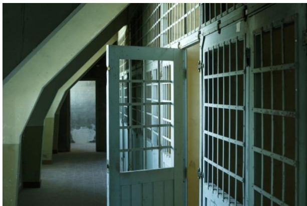
Combles nord et cellules de prisonnières

Dès le 15 février, le parcours de visite permanent du château, offre un quatrième niveau à visiter grâce à l'ouverture au public des combles, rendue possible par des travaux d'aménagement réalisés en 2018 par le Centre des monuments nationaux.