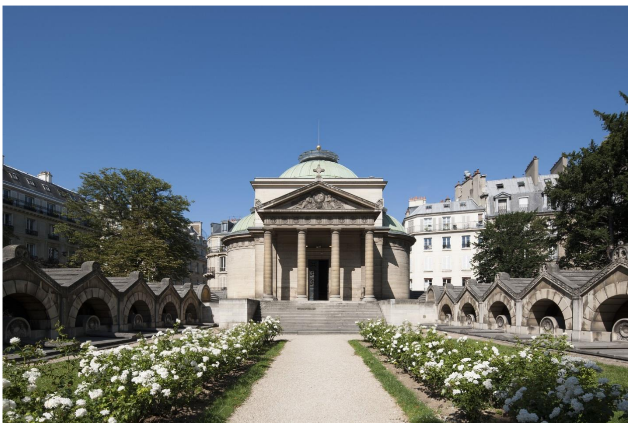
Chapelle expiatoire, façade orientale vue depuis le portique d'entrée

Pour la journée internationale des droits des femmes, le Centre des monuments nationaux et la mairie du 8 e arrondissement de Paris proposent « le Moi des femmes » à la Chapelle expiatoire des événements culturels sur tout le mois de mars