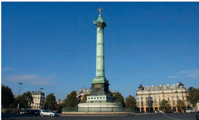
Regards sur la colonne de Juillet, et la place de la Bastille | 32