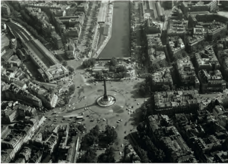
Roger Heverlé, Vue aérienne de la place de la Bastille, photographie 1968, photographie (Paris, musée Carnavalet)

Le boulevard Richard-Lenoir, avec un tracé plein centré planté d'arbres, recouvre depuis 1850 une partie du canal Saint-Martin. Après que la tranchée du canal a servit de ligne de séparation aux butards parisiens en 1848 et juin 1849, le bassin d'assainissement supprime la coupure en la transformant en glacis, facilitant ainsi les charges de la troupe responsable