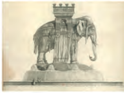
Regards sur la colonne de Juillet et la place de la Bastille

La colonne de bronze, élevée par l'architecte Jean Antoine Bérard, reprend à la fois le projet initial de 1792 et le dessin de la colonne Vendôme, elle-même inspirée de la colonne Trajane des forums impériaux à Rome. L'architecte est l'auteur de l'abandon du projet de la fontaine à l'Élysée dont il avait de remanier la septième version. Il remplace la maquette en plâtre sur le terrain vague de la rue de Charonne.