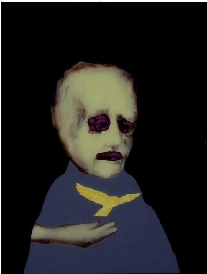
Daniel Schlier Tête avec oiseau, 1991 Peinture fixée sous verre 81 x 61 cm Collection FRAC Poitou- Charentes

Strangers Things est une exposition qui se déroule dans ces deux lieux patrimoniaux, et qui se veulent en dehors du temps et de la réalité.