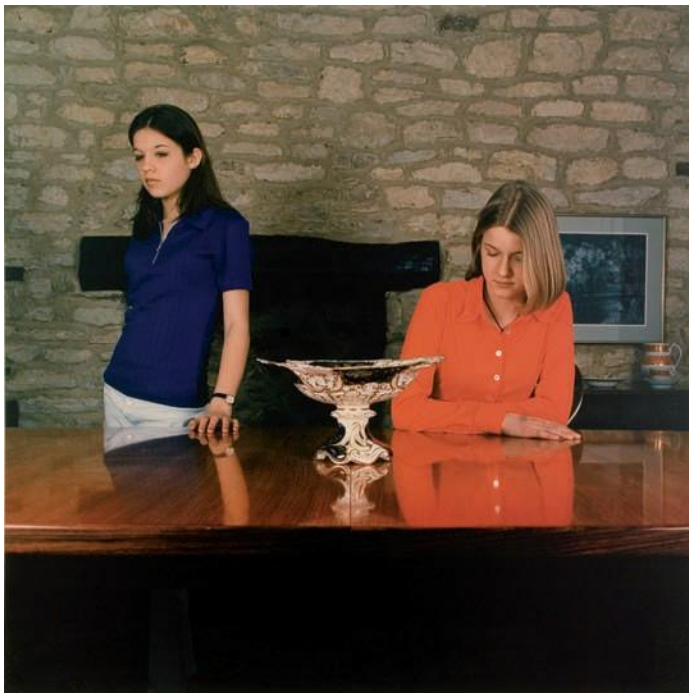
Sarah Jones The Dining Room (Mulberry Lodge) II 1997

Photographie couleur sur aluminium 150 x 150 cm collection FRAC Poitou-Charentes