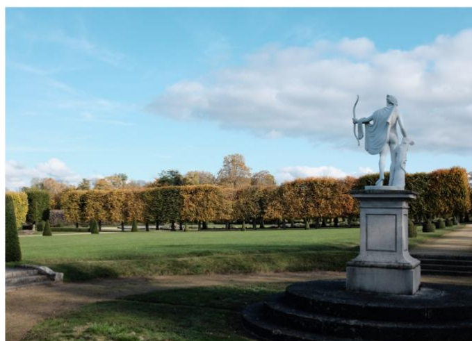
Parterre d'Apollon