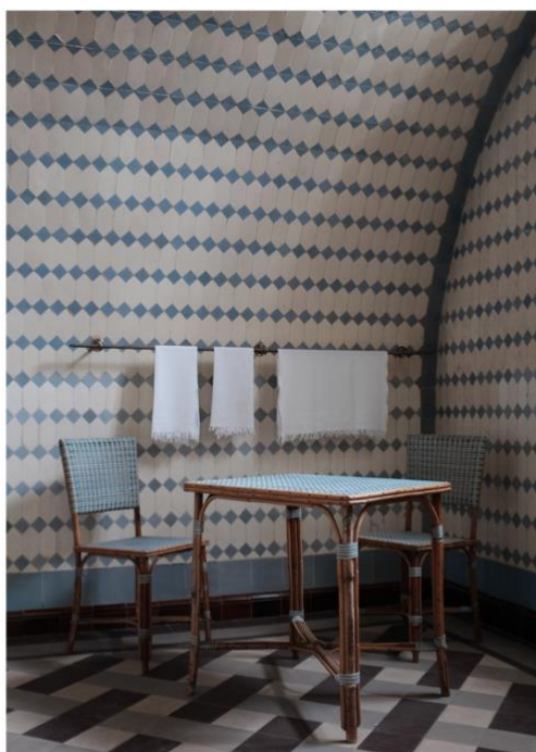
Salle de bains de Louis Cahen d'Anvers