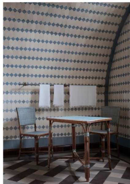
Le Grand salon du château de Champs-sur-Marne et la salle de bain de Louis Cahen d'Anvers ©Pablo Labèque

Dans le cadre de l'opération #Culturecheznous lancée par le ministère de la Culture, le Centre des monuments nationaux anime les réseaux sociaux du château de Champs-sur-Marne avec l'exposition virtuelle « Voyage à Champs-sur-Marne » par l'artiste Pablo Labèque, chaque lundi et vendredi.