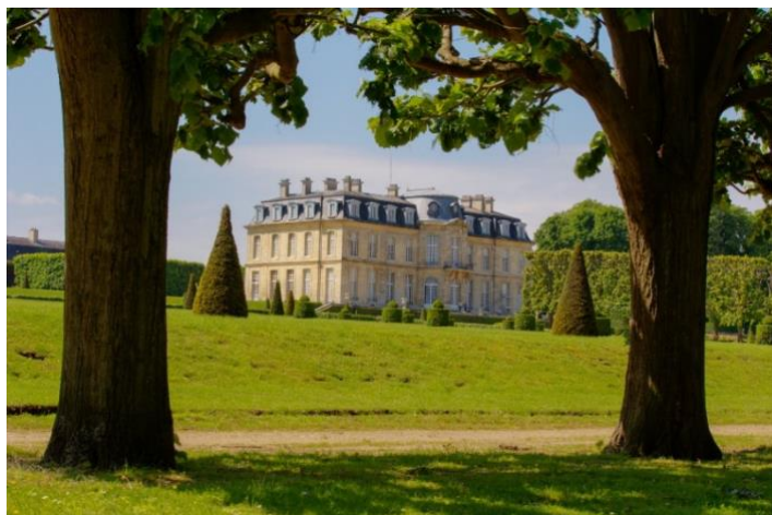
Le château de Champs-sur-Marne

Le château de Champs est l'un des plus beaux exemples de l'architecture classique en Ile-de-France. Proche de Paris, il s'insère dans le vaste domaine que s'était constitué le financier Paul Poisson de Bourvallais à la fin du règne de Louis XIV. Il est construit entre 1703 et 1707 par les architectes Pierre Bullet et Jean-Baptiste Bullet de Chamblain. Le domaine est bâti en un lieu champêtre et éloigné de la capitale, comme une maison de plaisance qui permet d'échapper aux lourdeurs de la cour et de profiter de