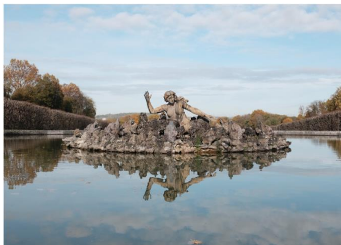
Bassin de Scylla