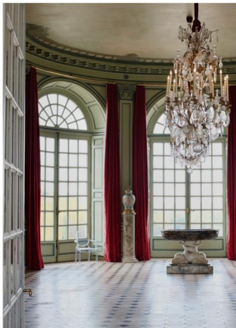
Le grand salon