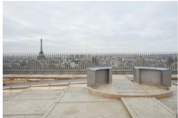
© Antoine Mercusot / Chatillon Architectes

En 2017, le Centre des monuments nationaux a engagé sous la maîtrise d'œuvre de l'agence Chatillon Architectes d'importants travaux permettant d'améliorer l'accessibilité de l'Arc de triomphe et le confort de ses visiteurs. Afin de garantir l'accès de tous à la plateforme sommitale, le monument est désormais équipé de rampes de circulation permettant de franchir les dénivellations de la terrasse, ainsi que d'un élévateur assurant la liaison avec la salle du musée. Des sanitaires adaptés aux personnes à mobilité réduite ont également été ouverts au niveau du musée. Enfin, les conditions de sécurité ont été renforcées par la construction d'un escalier supplémentaire dans le pilier nord-ouest. Cet escalier devient un élément facilitant les évacuations d'urgence mais il dessert également les salles intermédiaires destinées aux groupes profitant d'ateliers pédagogiques.