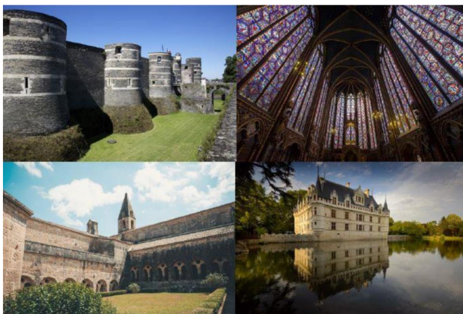
Château d'Angers / Sainte-Chapelle / Abbaye du Thoronet / Château d'Azay-le-Rideau