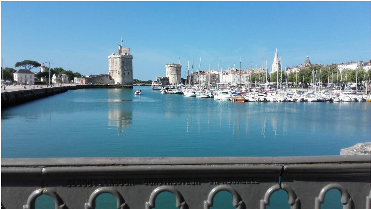
Tours de La Rochelle

Dressées face à l'Atlantique, les trois tours de La Rochelle, tours Saint-Nicolas (XIV e siècle), de la Chaîne (XIV e siècle) et de la Lanterne (XII e et XV e siècles), de style gothique, sont les vestiges d'un grand programme de fortifications édifié à partir du XII e siècle par la ville.