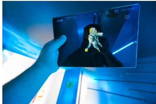
Tablette permettant de découvrir l'univers de Mathieu Bablet