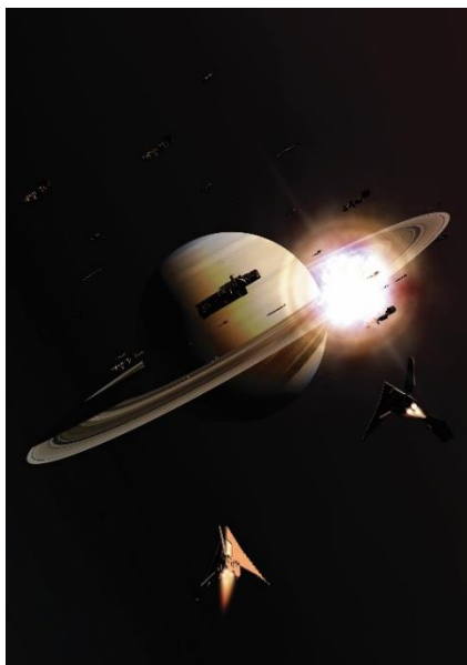
Extrait du film inspiré de Universal War One visible dans le module Denis Bajram par le biais d'un casque de réalité virtuelle