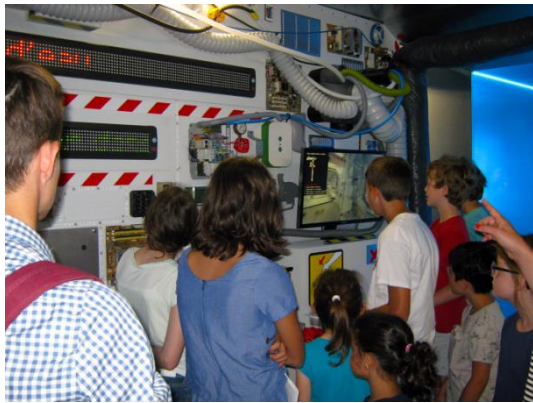
Le module Marion Montaigne