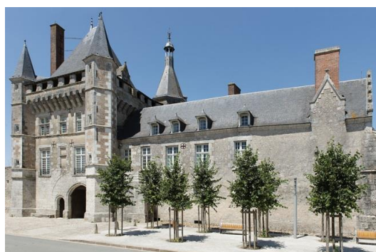
Château de Talcy, façade sur rue