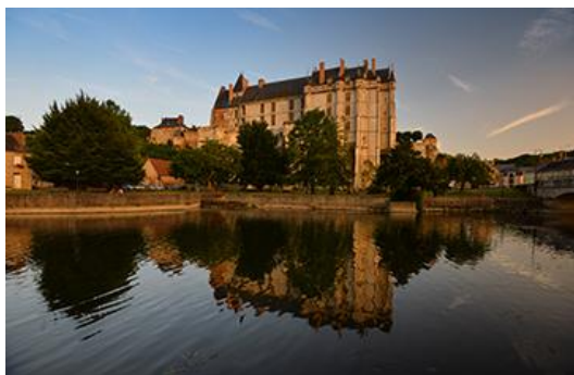
Château de Châteaudun, façades sur le Loir