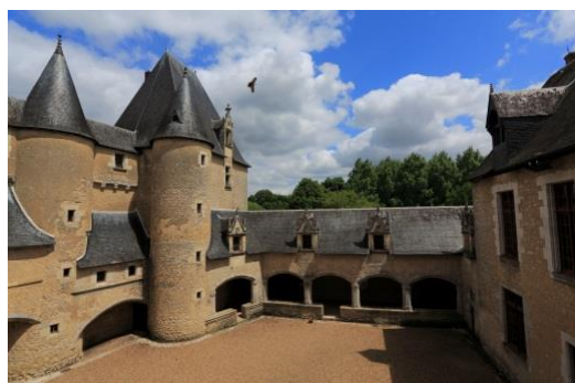
Château de Fougères-sur-Bièvre, cour intérieure