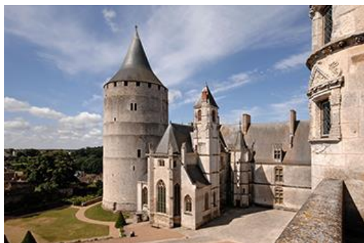
Château de Châteaudun, façades sur la cour