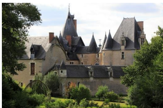
Château de Fougères-sur-Bièvre, aile nord depuis la Boulas.