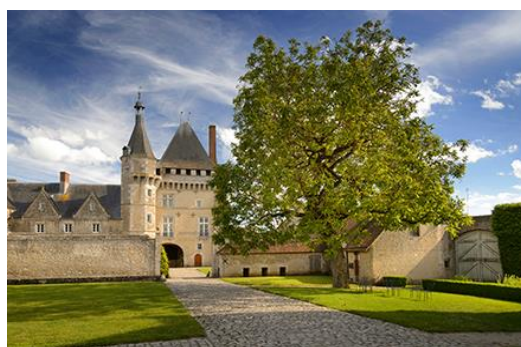
Château de Talcy, façade sur cour