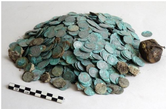
Avant restauration

En septembre 2017, les fouilles archéologiques menées dans les jardins de l'abbaye de Cluny par l'Université Lyon 2 – CNRS UMR 5138 ont révélé un incroyable trésor monétaire : près de 2200 deniers et oboles clunisiens en argent. C'est la première fois qu'un tel trésor monétaire, réuni dans un ensemble clos, est retrouvé. Cette découverte majeure fait actuellement l'objet de nombreuses recherches (notamment dans le domaine de la numismatique), ainsi que de restaurations importantes, pour redonner à l'ensemble tout son éclat.