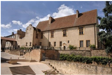
Palais Jean de Bourbon