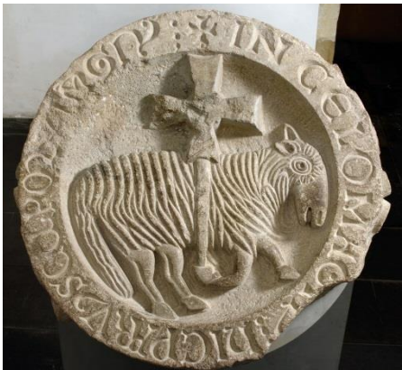
Clé de voûte de l'agneau pascal

peintures anciennes, mobilier, arts graphiques, livres (dont une partie de l'ancienne bibliothèque de l'abbaye)... composent la riche collection du musée. Une mention particulière doit être faite du fonds Pierre Paul Prud'hon (1758-1823), célèbre peintre originaire de Cluny.